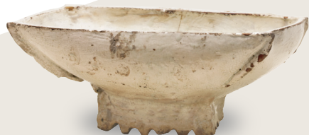
粉青粉引盞 朝鮮時代・15世紀 住友グループ寄贈/安宅コレクション