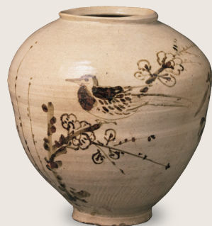
鉄砂梅鳥文壺 朝鮮時代・17世紀後半 李秉昌博士寄贈