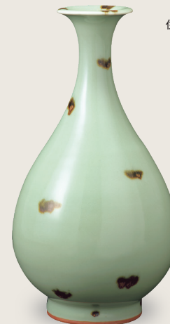
国宝 飛青磁花生 元時代・14世紀 龍泉窯 住友グループ寄贈/安宅コレクション