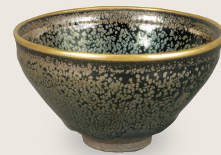
国宝 油滴天目茶碗 南宋時代・12-13世紀 建窯 住友グループ寄贈/安宅コレクション