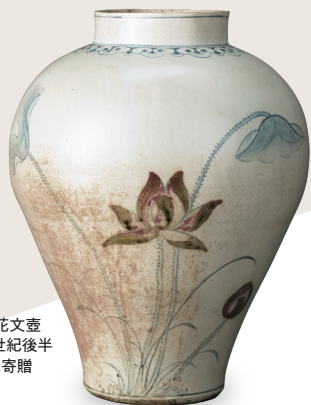
青花辰砂蓮花文壺 朝鮮時代・18世紀後半 安宅英一氏寄贈