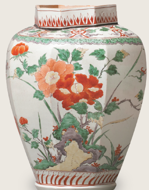
色絵牡丹椿文八角壺 江戸時代・1680-1710年代 肥前・有田窯