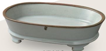
青磁水仙盆 北宋時代・11世紀末-12世紀初 汝窯 住友グループ寄贈/安宅コレクション