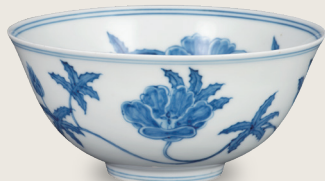
青花黃蜀葵文碗 〔大明成化年製〕銘 明時代・成化(1465-1487) 景德鎮窯 住友グループ寄贈/安宅コレクション