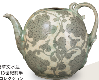
重要文化財 青磁象嵌童子宝相華唐草文水注 高麗時代・12世紀後半-13世紀前半 住友グループ寄贈/安宅コレクション