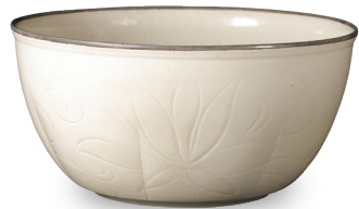
重要文化財 白磁刻花蓮花文洗 北宋時代・11-12世紀 定窯 住友グループ寄贈/安宅コレクション