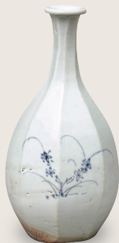
青花草花文面取瓶 朝鮮時代・18世紀前半 住友グループ寄贈/安宅コレクション