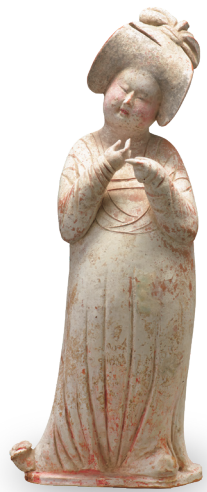
加彩婦女俑 唐時代・8世紀 住友グループ寄贈/安宅コレクション