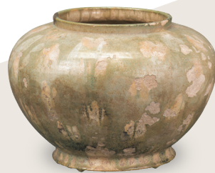
重要文化財 三彩壺 奈良時代・8世紀 住友グループ寄贈/安宅コレクション