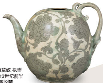
重要文化财 青瓷镶嵌 童子宝相花卷草纹 执壶 高丽时代, 12世纪后半-13世纪前半 住友集团捐赠/安宅收藏