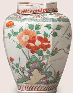
彩绘 牡丹梅花纹 八棱罐 江户时代, 1680-1710年代 肥前 有田窑