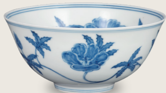
青花 蜀葵纹 碗(“大明成化年制”铭) 明时代, 成化 (1465-1487) 景德镇窑