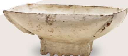
粉青粉引 簋 朝鲜时代, 15世纪 住友集团捐赠/安宅收藏