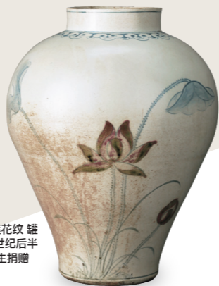
青花铜红彩 莲花纹 罐 朝鲜时代, 18世纪后半 安宅英一先生捐赠