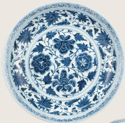
重要文化财 青花 牡丹卷草纹 盘 元时代, 14世纪 景德镇窑 东畑謙三先生捐赠